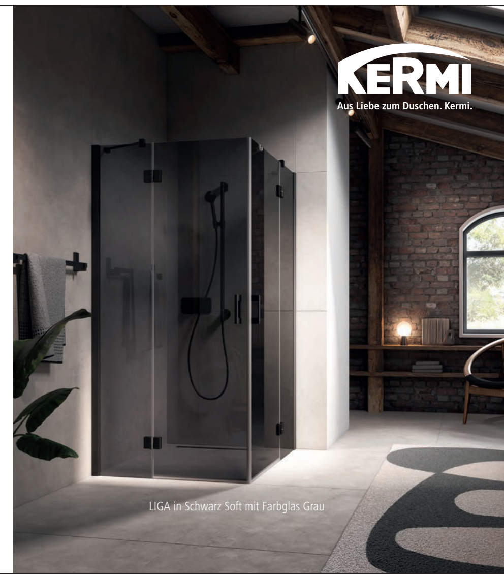
LIGA in Schwarz Soft mit Farbglass Grau

kermi-design.ch | info@kermi-design.ch | 071 440 57 57